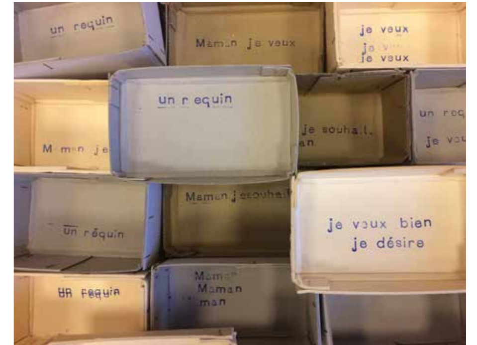
Julia Brodauf Herzenswünsche, 2019: Installation aus Pappkartons und Stempelschrift, Maße variabel