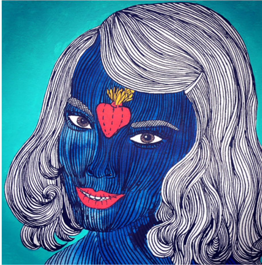
Niki Elbe Am I Pretty? No, You're Beautiful XXIII, 2017: Aquarell, Tusche und Acryl auf Büttchen, 20x20 cm