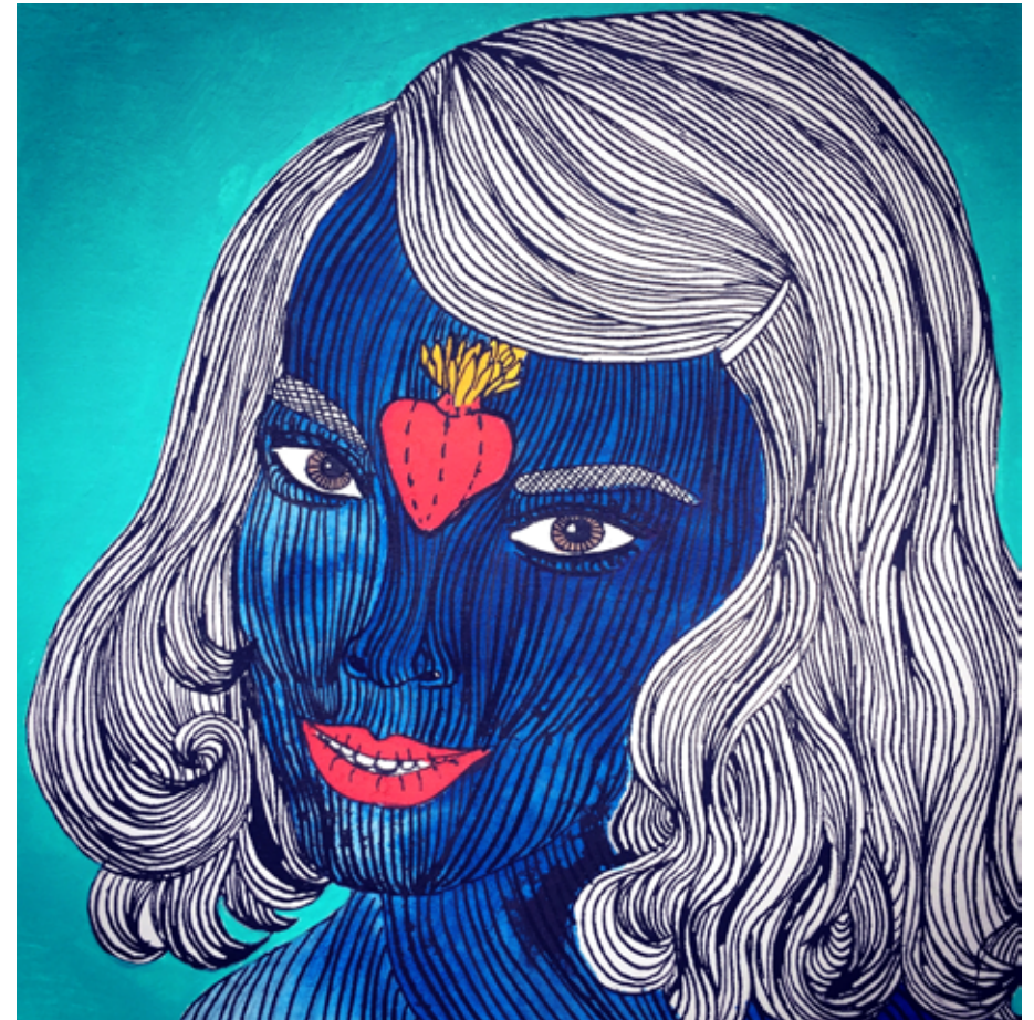
Niki Elbe Am I Pretty? No, You're Beautiful XXIII, 2017: Aquarell, Tusche und Acryl auf Büttchen, 20x20 cm